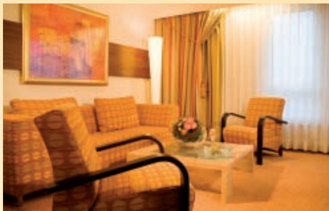
Das Radisson Hotel reserviert für Hochzeitspaare gerne eine von vier Suiten.