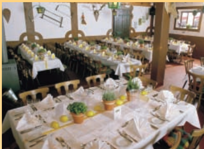
Der „Kuhstall“ der Knittelsheimer Mühle – das rustikale Hochzeitsambiente.

■ Radisson SAS Hotel Am Hardtwald 10, 76275 Ettlingen Telefon (07243) 3800, Fax 380666 E-Mail: info.karlsruhe@radissonsas.de www.karlsruhe.radissonsas.com