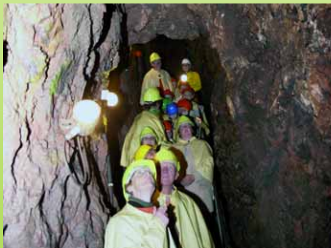
Das Besucherbergwerk „Frischglück“ bei Neuenbürg im Nordschwarzwald.

■ Infos: genussradeln-pfalz.de Im Tränkweg 18 67482 Venningen Telefon (0 63 23) 6209 www.genussradeln-pfalz.de