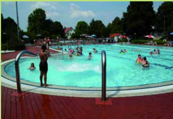
Ab ins kühle Nass im Freibad Wölfle, das am 1. Mai 2012 die Pforten öffnet.