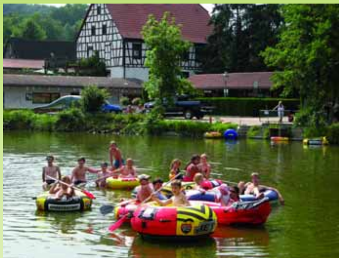
Eine naturnahe Erholung bietet der Campingplatz Pfrimmtal im Pfälzer Wald.