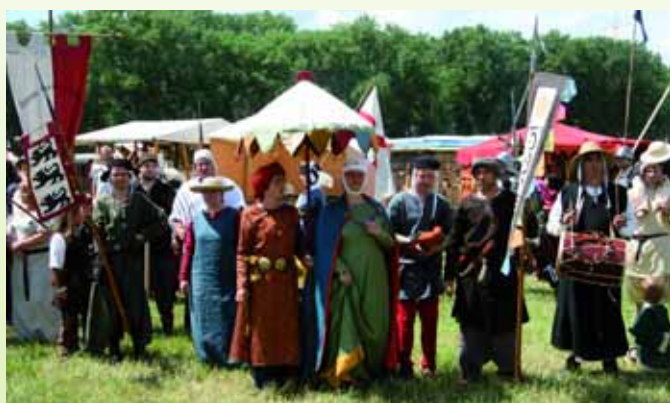
Das 4. Große Mittelalter Spectaculum in Philippsburg vom 26. bis 28. Mai.