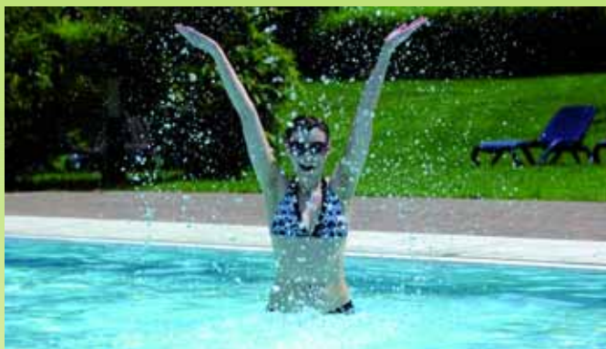
Die Siebentäler Therme Bad Herrenalb – auch im Sommer einen Besuch wert.

WellnessWelt Prießnitz-Spa: Montag - Freitag 13.00 - 22.00 Uhr Sa, So und Feiertag 9.00 - 22.00 Uhr Damensauna: Donnerstags 13.00 - 17.30 Uhr (außer an Feiertagen) Führung durch die WellnessWelt Prießnitz-Spa: Montags 10.30 Uhr (kostenfrei) Musik und Entspannung bis Mitternacht: freitags im 14-tägigen Rhythmus ■ Siebentäler Therme Schweizer Wiese 9 76332 Bad Herrenalb Telefon (0 70 83) 9 25 90 www.siebentaelertherme.de