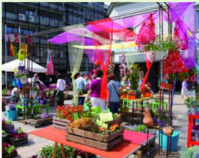
Blumen- und Gartenmarkt am Sonntag, 6. Mai in Neustadt an der Weinstraße.

Jedoch herrscht nicht nur in der Innenstadt reges Treiben, auch im nahe gelegenen Gewerbegebiet „Weinstraßenzentrum“ beteiligen sich Firmen und runden das Angebot ab. Ein Besuch in Neustadt an der Weinstraße lohnt sich auch an diesem Sonntag auf jeden Fall.