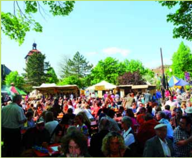
Bergfried-Spectaculum rund um das älteste Bauwerk Bruchsals vom 11.-13.5.