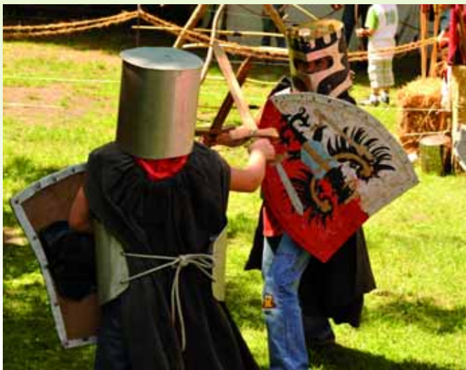
Spaß auch für die Kleinsten beim Burgfest auf Burg Guttenberg an Pfingsten.