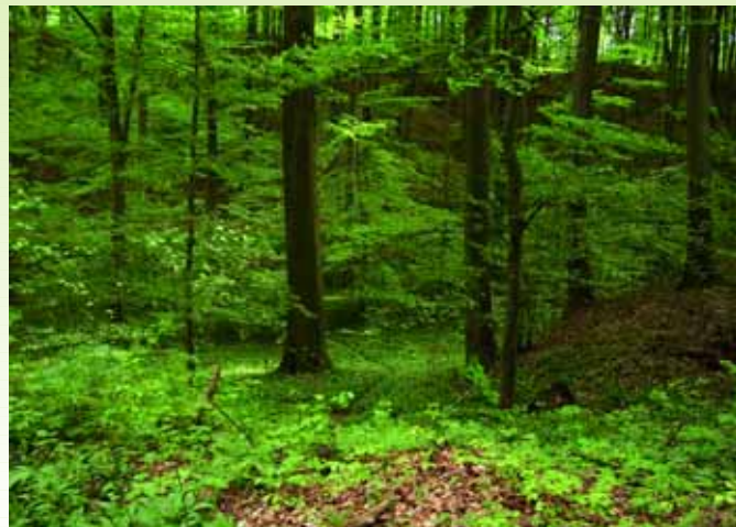
Die Wälder um Untergrombach stehen im Mittelpunkt einer Wanderung am 5.5.