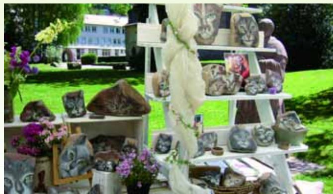
„Katzensteine“ auf dem Bad Herrenalber Kunsthandwerkermarkt 26.-28.5.

Weitere Informationen gibt es im Tourismusbüro, Rathausplatz 11, 76332 Bad Herrenalber Telefon (0 70 83) 500 555