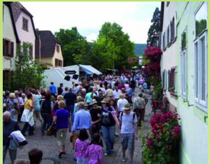
Festbetrieb auf der Theresienstraße beim Heimat- und Blütenfest in Rhodt.

Eine festliche Eröffnung findet freitags um 18 Uhr statt, beginnend mit dem Fassan-