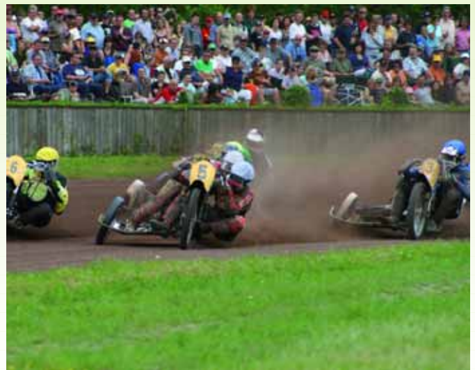
Duell der Seitenwagen beim Vatertagsrennen auf der Sandbahn in Herxheim.

■ 16. und 17. Mai 2012 114. Internationales Sandbahnrennen um den ADAC Silberhelm Mittwoch, 16. Mai: ab 15 Uhr Training/Vorläufe im Anschluss Sommernachtsfest Donnerstag, 17. Mai: ab 9 Uhr Training/Vorläufe 13.30 Uhr Rennbeginn Eintrittspreise: Mittwoch: Erwachsene 3 Euro (entfällt beim Kauf einer Eintrittskarte für Donnerstag) Donnerstag: Erwachsene 12 Euro, Jugendliche 13-17 Jahre 6 Euro, Kinder bis 12 Jahre frei; überdachter Sitzplatz auf der Tribüne 18 Informationen und Fahrerfelder immer aktuell auf www.speedway.de