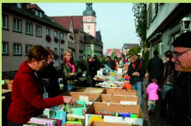
Bücher- und Papierflohmärkte entlang der Alb in Ettlingen am 5. Mai 2012.