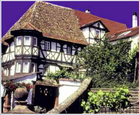
Jungen Union im Hof der „Alten Kellerei“