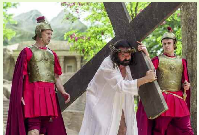
„Die Passion“ – nur noch wenige Male bei den Volksschauspielen Ötigheim.

■ Am 4., 5., 8., 9., 11., 12., 13. und 14. August, jeweils um 20.30 Uhr Weitere Informationen unter www.ettlingen.de/71353