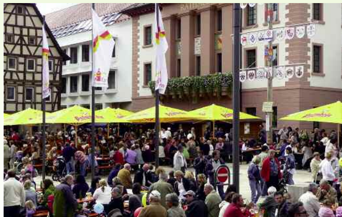
Der 17. Eppinger Kartoffelmarkt – in diesem Jahr am 29. und 30. August.

Vor 16 Jahren war es das Ziel und die Idee des Stadtmarketingvereines, den Eppinger Gastronomen eine Plattform zu bieten, sich und ihre Gerichte in lockerer ungezwungener Atmosphäre einem breiten Publikum zu präsentieren und von ihren Kochkünsten zu überzeugen. Und was ist typischer und bodenständiger für die Eppinger Küche als die Kartoffel. Schon in den 50-er Jahren hatte Eppingen den Ruf der Kartoffelstadt und dieser Ruf hat sich bis in die Gegenwart erhalten. Denn auch heute noch gibt es in Eppingen von den Anbauflächen und Erzeugern, über die Verarbeitung bis zu den Vermarktern funktionierende Strukturen in der Stadt. Somit ist die Kartoffel nicht nur wichtiges Kulturgut, sondern stellt auch weiterhin einen wichtigen Faktor für Eppingens Wirtschaft dar. Um diese Strukturen zu erhalten und den heimischen Gastronomen, den Kartoffelerzeugern und den Vermarktern als Bühne zur Werbung für ihre Produkte zu dienen, wurde der Kartoffelmarkt initiiert. Daher freut es die Veranstalter außerordentlich, dass der Kartoffelmarkt den Ge-