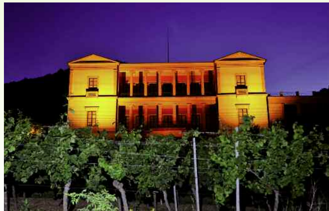
Schlossfest auf Schloss Villa Ludwigshöhe in Edenkoben am 28. August 2015.

Es war einmal ein König von Bayern, der Italien so sehr liebte, dass er sich in der Pfalz ein Domizil nach italienischem Vor-