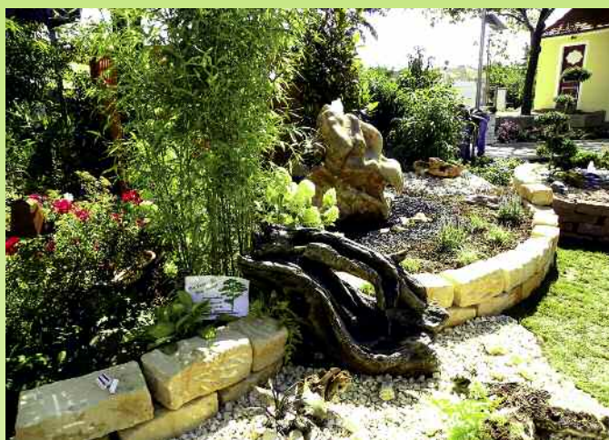
„Gartenkunst und Pfalzgenuss“ am 15. und 16. August 2015 in Maikammer.