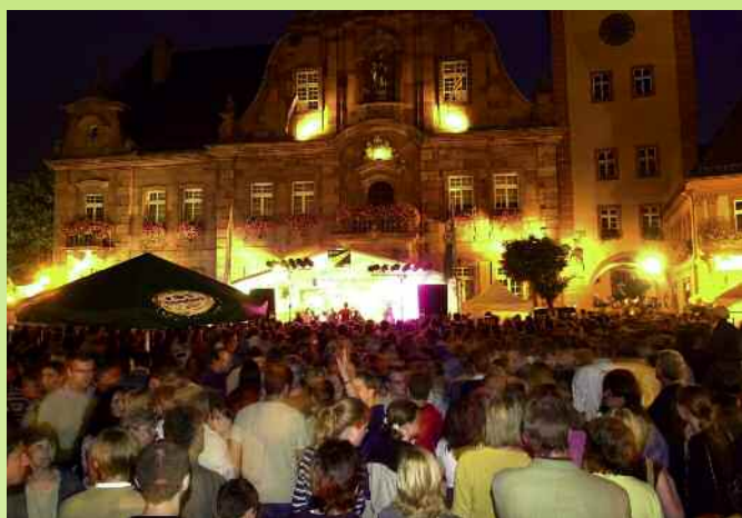
Das Marktfest in Ettlingen – eines der beliebtesten Feste in unserer Region.