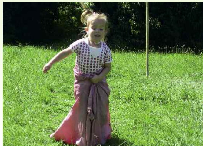
Das traditionelle Kinderfest beim Schupi – in diesem Jahr am Sonntag, 9.8.

■ Beim Schupi Hotel – Restaurant – Biergarten Durmshheimer Straße 6 76185 Karlsruhe Telefon (07 21) 55 12 20 www.schupi.de