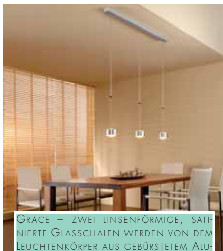
GRACE – ZWEI LINSENFÖRMIGE, SATI NIERTE GLASSCHALEN WERDEN VON DEM LEUCHTENKÖRPER AUS GEBÜRSTETEM ALUMINIUM EINGEFASST UND BRECHEN DAS LICHT GLEICHMÄSSIG UND BLENDFREI.