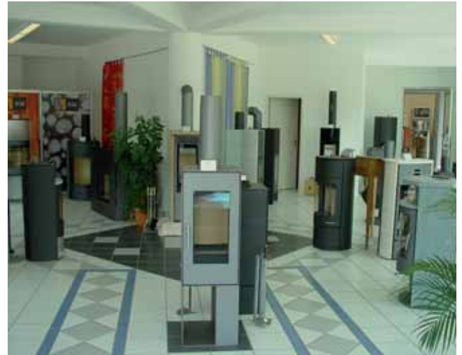
Die Ausstellung im Karlsruher Haus Comfort Studio wurde jetzt erweitert und vergrößert. Die Kunden finden hier eine Vielzahl an neuen Modellen.