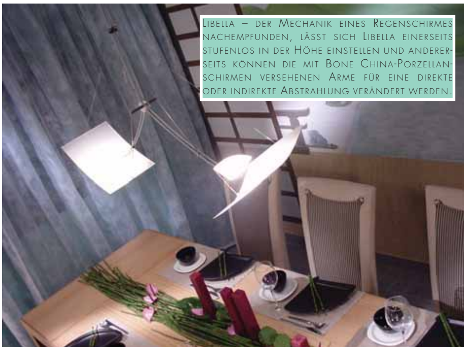
LIBELLA – DER MECHANIK EINES REGENSCHIRMES NACHEMPFFUNDEN, LÄSST SICH LIBELLA EINERSEITS STUFENLOS IN DER HÖHE EINSTELLEN UND ANDERERSEITS KÖNNEN DIE MIT BONE CHINA-PORZELLAN-SCHIRMEN VERSEHENEN ARME FÜR EINE DIREKTE ODER INDIREKTE ABSTRAHLUNG VERÄNDERT WERDEN.