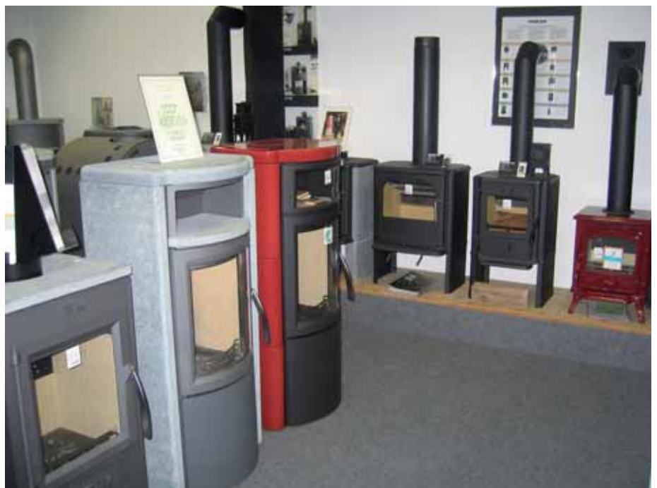
Kaminöfen von Varde Ovne – aber auch vieler anderer Hersteller – finden sich bei Vogelbacher in Landau.

Das Prädikat ist ein Nachweis für ein umweltfreundliches Fertigprodukt und eine umweltfreundliche Produktion.