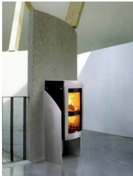
Großzügig und futuristisch – der xeos X8 PUR lässt das doppelte Feuer elegant im Raum schweben. Die gewölbte Tür bietet viel Einblick in das TwinFire und der Glasstehrost gibt freie Sicht auf die katalytische Verbrennung.

Montag, Dienstag und Freitag 12-18 Uhr, Donnerstag 12-20 Uhr, Samstag (Februar bis September) 10-13 Uhr, Samstag (September bis Januar) 10-16 Uhr, mittwochs geschlossen. Auch außerhalb der angegebenen Öffnungszeiten können Sie einfach einen Termin ausmachen.