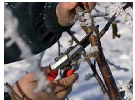
Voraussetzung für vernünftig durchgeführte Schnittmaßnahmen ist das passende Schneidewerkzeug.

Ziel ist es, durch gleichmäßiges Auslichten und Rücknahme der gesamten Krone, einen arttypischen und einheitlichen Habitus zu erhalten, bzw. sich wieder entwickeln zu lassen. Sollten immer noch Fehlstellungen von Ästen vorhanden sein, sind diese ebenfalls zu korrigieren, wie auch die Entnahme von Totholz.