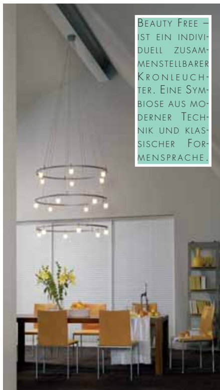
BEAUTY FREE – IST EIN INDIVIDUELL ZUSAMMENSTELLBARER KRONLEUCHTER. EINE SYMBIOSE AUS MODERNER TECHNIK UND KLASZISCHER FORMENSPRACHE.