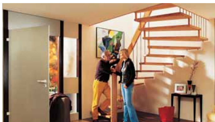
Massives Hartholz zählt im Einfamilienhausbau zu den beliebten Materialien für Treppen. Beim Geländer sorgen Kombinationen mit Edelstahl oder Glas für abwechslungsreiche Variationen.

Ratgeber „Die Technische Information“ zusammengefasst, der kostenlos angefordert werden kann bei der Zentrale: Bucher GmbH, Ringstraße 4-6, 71131 Jettingen oder auch im Internet unter www.bucher-treppen.de