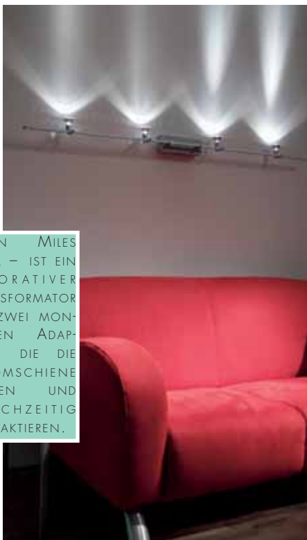
SEVEN MILES FINAL – IST EIN DEKORATIVER TRANSFORMATOR MIT ZWEI MONTIERTEN ADAPTERN, DIE DIE STROMSCHIENE TRAGEN UND GLEICHZEITIG KONTAKTIEREN.