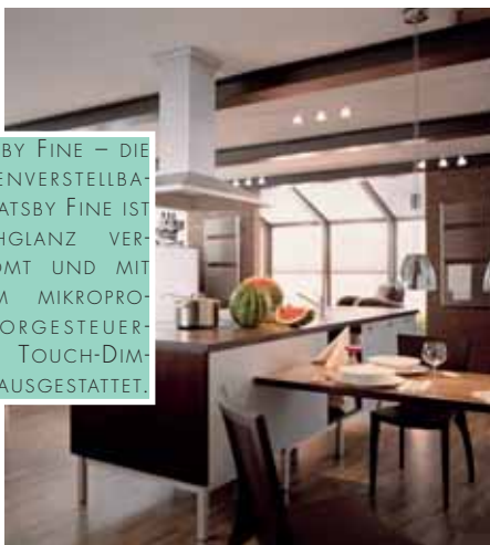
GATSBY FINE – DIE HÖHENVERSTELLBARE GATSBY FINE IST HOCHGLANZ VERCHROMT UND MIT EINEM MIKROPROZESSORGESTEUERTEN TOUCH-DIMMER AUSGESTATTET.