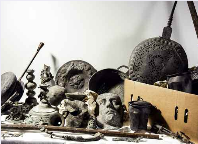
Brandschutt – ausgewählte Metallobjekte aus dem zerstörten Karlsruher Schloss erzählen vom Schrecken des Krieges.

■ „OMG! Objekte mit Geschichte“ Wenn Dinge sprechen könnten – sie hätten unglaubliche Geschichten zu erzählen! Manche davon muten so skurril und überraschend an, dass dem Zuhörer ein verblüfftes „Oh my God!“ entfährt. Diese Geschichten überhaupt erst zu entdecken und sie in einer Ausstellung einer breiten Öffentlichkeit lebendig zu präsentieren, ist die Leistung der Nachwuchswissenschaftler, der Volontärinnen und Volontäre, am Badischen Landesmuseum. Mit ihrer frischen Herangehensweise und neuen Methoden vermitteln sie, wie faszinierend die Arbeit im Museum und am Exponat selbst sein kann – und wie wertvoll der Ansatz der Provenienzforschung für das grundsätzliche Verständnis von Museumsgut ist.