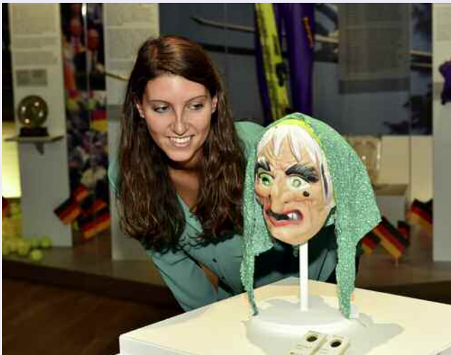
Die Hexenmaske aus der Asservatenkammer der Staatsanwaltschaft diente 1987 bei einem Bankraub als Tarnung.

Noch bis Ende Mai präsentiert die Sonderausstellung „OMG! Objekte mit Geschichte“ vor allem nie zuvor gezeigte Exponate, berichtet von ihren Schicksalen sowie den Menschen hinter den Dingen. Angefangen bei einer großen Depotinstallation im Foyer führt ein Wegeleitsystem die Besucherinnen und Besucher zu 27 Stationen auf allen vier Etagen des Karlsruher Schlosses. Im Unterschied zu einer konventionellen Ausstellung steht bei „OMG!“ nicht die kulturgeschichtliche oder künstlerische Bedeutung der Objekte im Vordergrund. Vielmehr liegt der Fokus auf Erzählungen, wie die einzelnen Stücke oftmals auf verschlungenen Wegen ins Museum gelangt sind. Die Herkunft – Provenienz – der Sammlungsgegenstände ist heute mehr denn je Gegenstand der Forschung. Dabei ist das Ziel, die Geschichte eines Objektes und seiner Besitzer vollständig aufzuklären. Aktuell bekannt sind derzeit vor allem die Forschungen zu während der NS-Diktatur verfolgungsbedingt entzogenem Kulturgut.