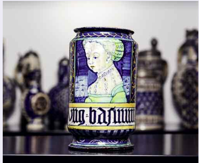
Ein reisefreudiges Apothekergefäß: Albarello, Castelli (?), Anfang 16. Jahrhundert.

Neben diesem sehr ernsten Thema erzählt die Ausstellung aber auch von kuriosen oder ganz persönlichen „Objektgeschichten“. Die von den Jungwissenschaftlern bei ihren Forschungen aufgedeckten Geschichten sind sehr amüsant. Da hat z.B. vor knapp 100 Jahren ein Pfarrer bei Grabungsarbeiten mitgewirkt – und von den gefundenen Objekten aus der vorrömischen Eisenzeit drei Gefäße als Souvenir einfach behalten. Selbst nach mehrmaliger Aufforderung verweigerte der Kirchenmann die Rückgabe. 2010 stieß die Urenkelin auf den