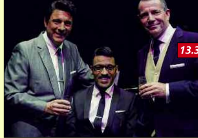
13.3.: Sinatra & Friends