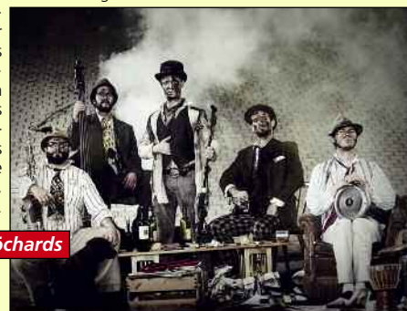
17.3.: The Les Clöchards

Die The Les Clöchards haben sich 2005 als Straßenmusikband in gegründet und sind seitdem quer durch Europa unterwegs. Nach 3 Jahren Straßenmusik auf unzähligen mediterranen Boulevards und etwa 15.000 verkauften Exemplaren ihrer CDs wurde die Straße gegen die Bühne ausgetauscht: Die Band spielte in den letzten Jahren über 350 Konzerte in Frankreich, Deutschland, Österreich, Italien, Polen, UK und der Schweiz. Sei es auf dem Sonnendeck einer elitären Luxusyacht in St. Tropez, einem Comedystüberl in Hintertupfingen, einem bierbäuchigen Bikerfestival von H. Davidson in Ischgl, einem verrauchten Kellerclub in London oder der edlen Genfer Fernsehpreisverleihung – die The Les Clöchards spielen überall. Sie begeisterten ebenso im bayerischen Fernsehen bei der Verleihung des Kabarettpreises sowie mit 30 Auftritten beim Fringe-Festival in Edinburgh, wo sie sowohl das schottische Publikum als auch sämtliche Kritiker überzeugten. Am Donnerstag, den 17. März um 20 Uhr im Tollhaus.