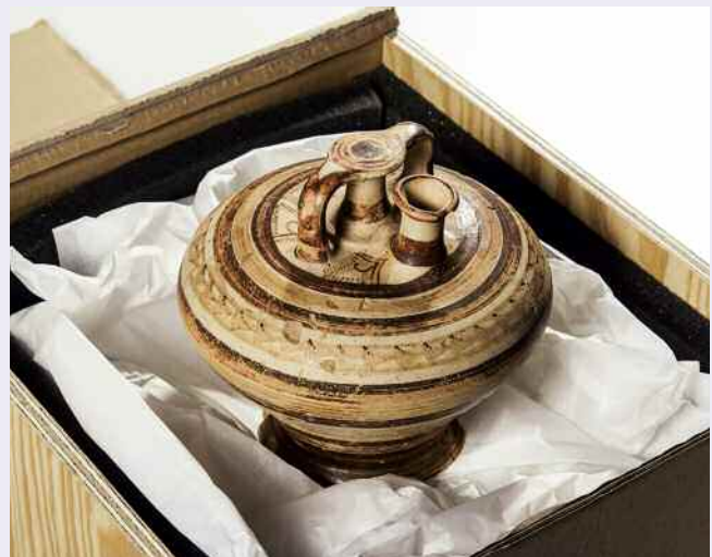
Lukratives Tauschgeschäft: Vor rund 60 Jahren wurde diese antike Bügelkanne in einem Krämerladen in Athen gegen einen Phillips-Rasierer eingetauscht.

Noch bis zum 29. Mai 2016 im Badischen Landesmuseum.